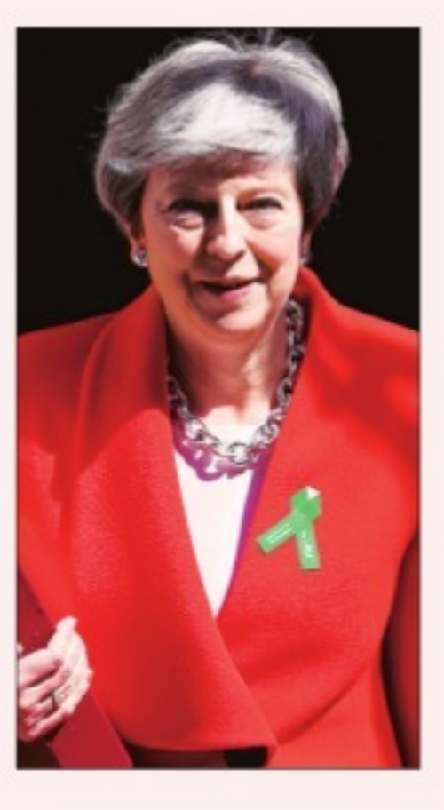
Prime Minister Theresa May

Britain's MPs on all sides of the Brexit divide vowed to once